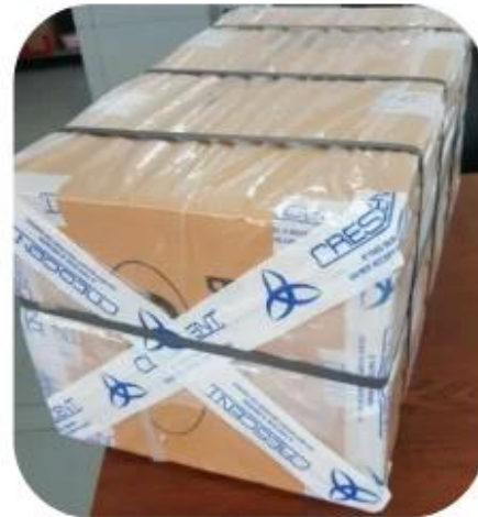
12.1 Final Packaged in Carton

Totally approx 28 QC workers, 4 QC steps to Guarantee the Quality