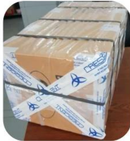
12.1 Final Packaged in Carton