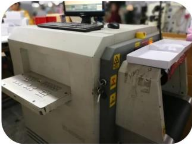
11.1 Finished Products Metal X-ray Detector

10.1 Package (polybag, cotton bag, gift box for your choosing)