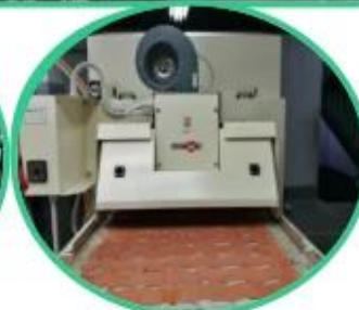
Glue Machine for Leather