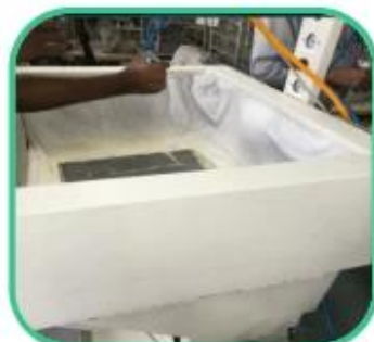
Glue Machine for Lining