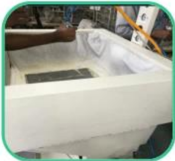
Glue Machine for Lining