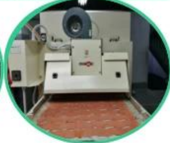
Glue Machine for Leather