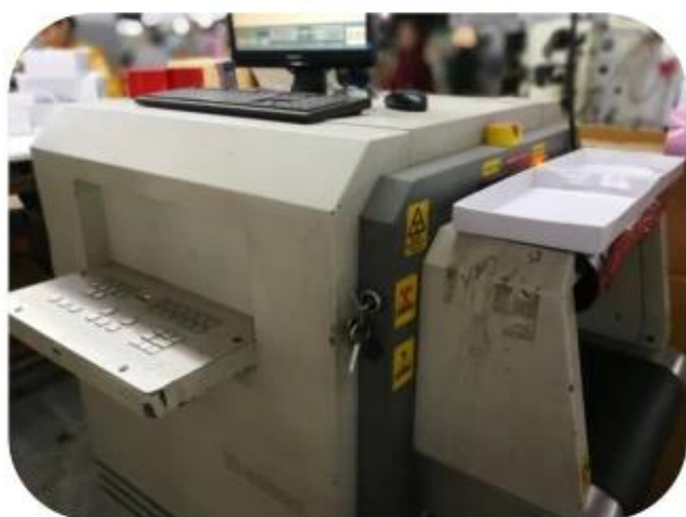
11.1 Finished Products Metal X-ray Detector

10.1 Package (polybag, cotton bag, gift box for your choosing)