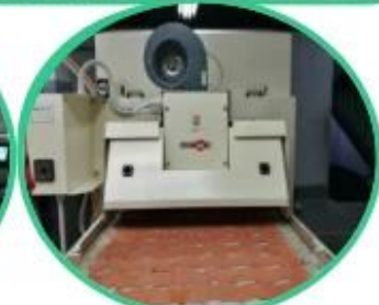
Glue Machine for Leather