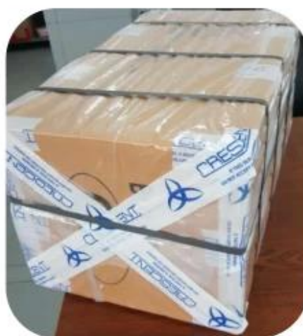
12.1 Final Packaged in Carton