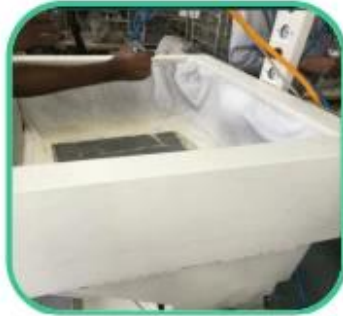
Glue Machine for Lining