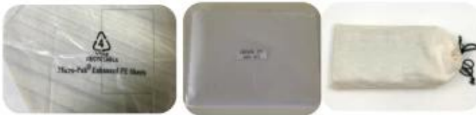
10.1 Package (polybag, cotton bag, gift box for your choosing)