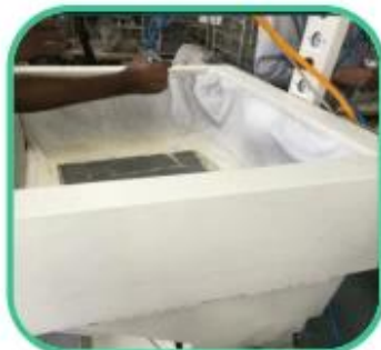
Glue Machine for Lining