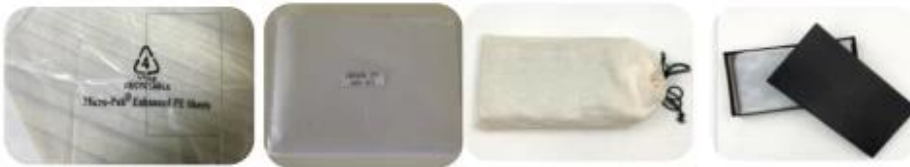
10.1 Package (polybag, cotton bag, gift box for your choosing)